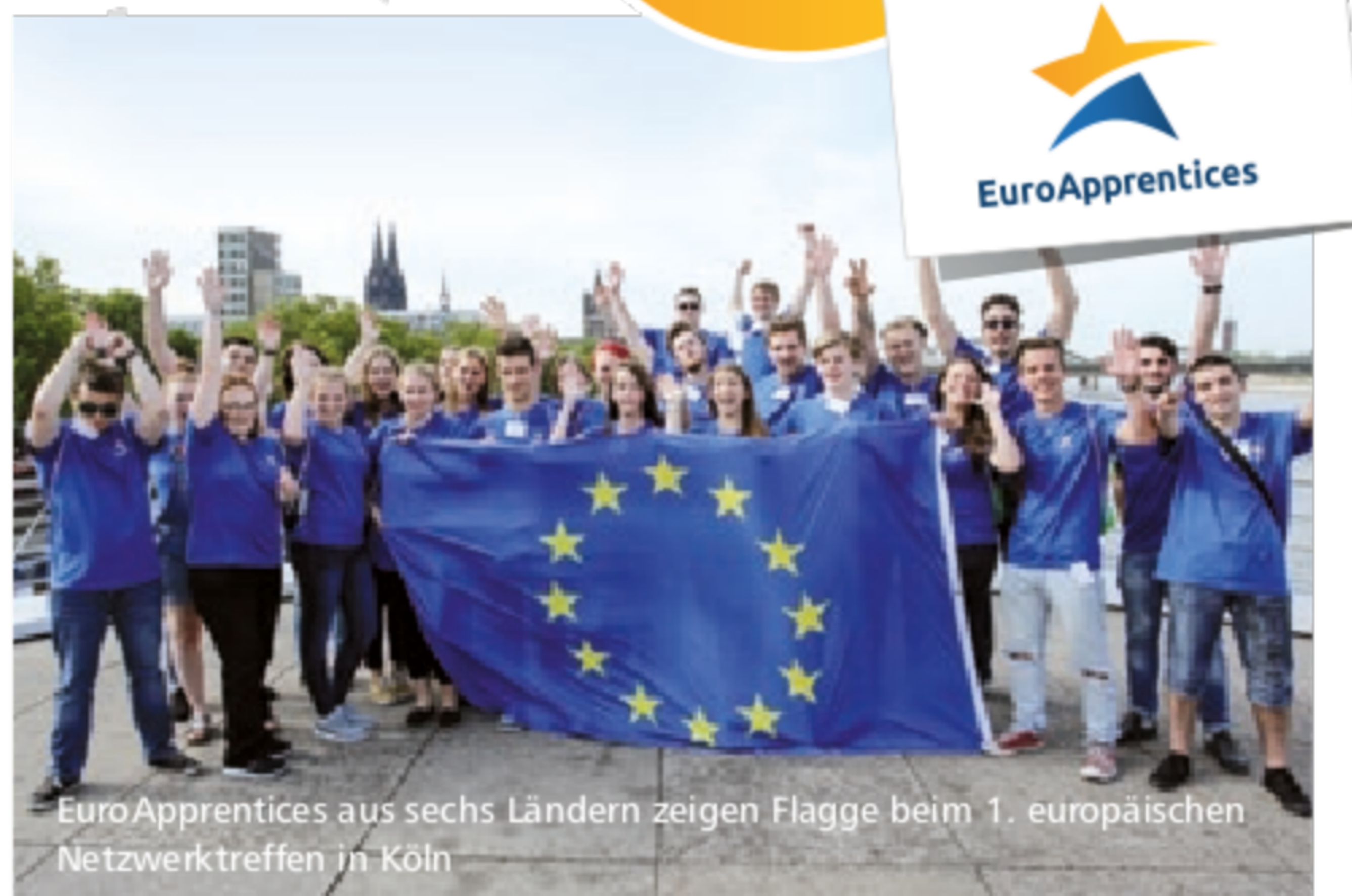
EuroApprentices aus sechs Ländern zeigen Flagge beim 1. europäischen Netzwerktreffen in Köln