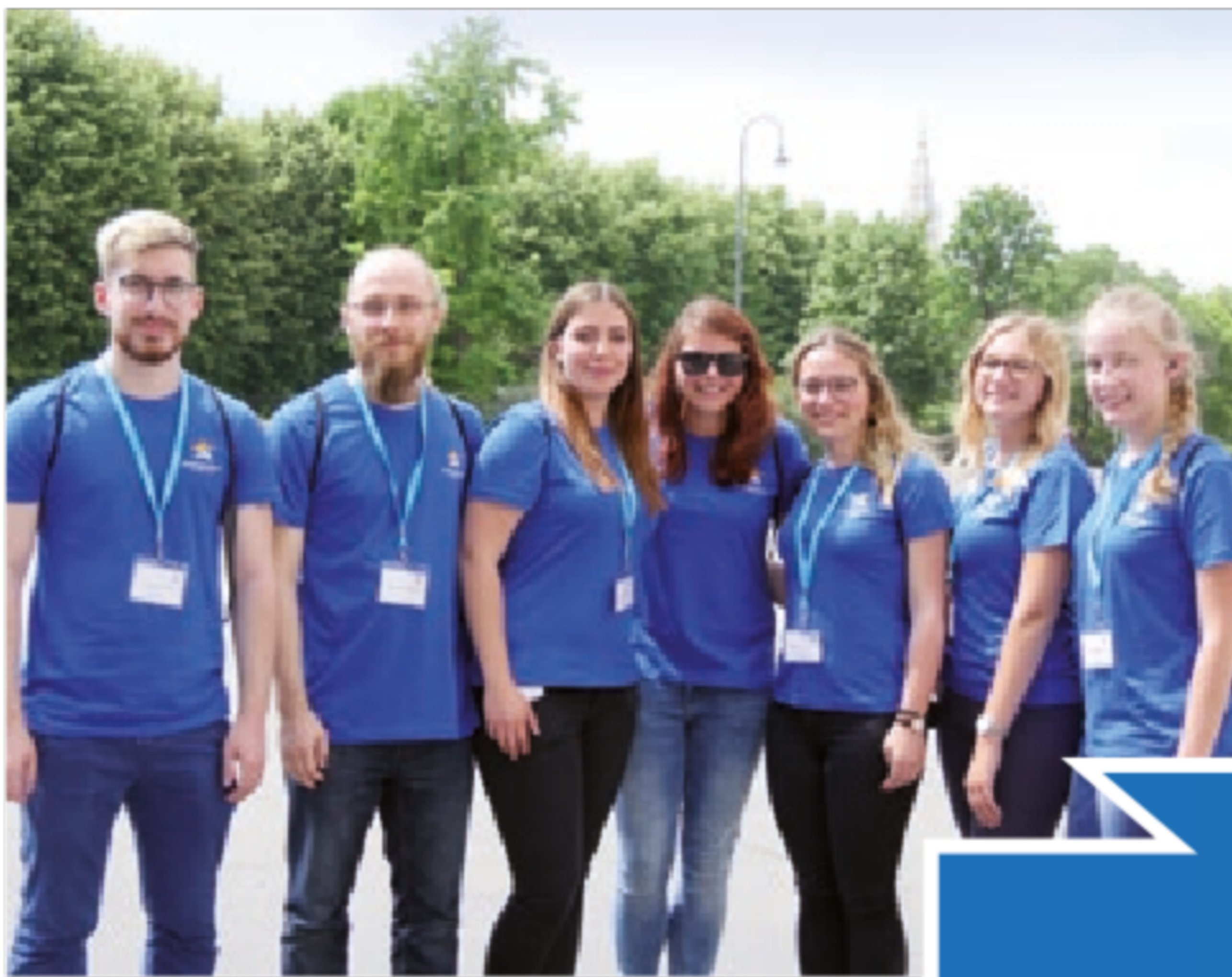
Vertreter der deutschen EuroApprentices beim 2. europäischen Netzwerktreffen in Wien