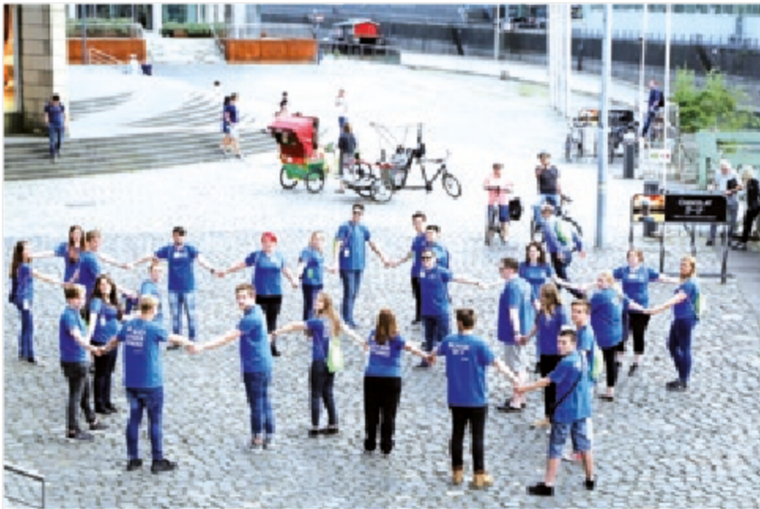
Gemeinsame Aktivität auf dem 1. europäischen Netzwerktreffen in Köln