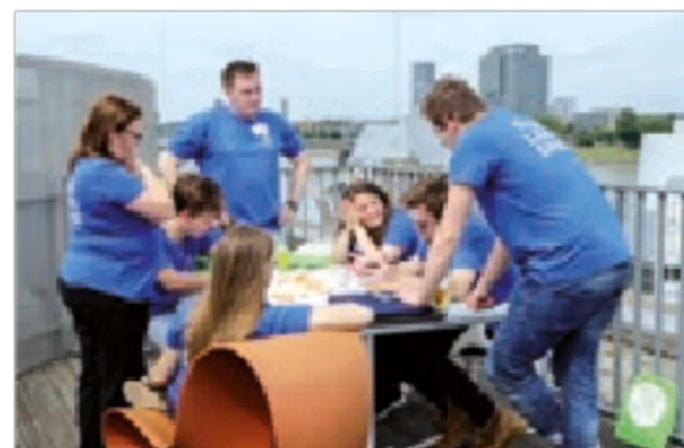
Abb. links: EuroApprentices auf einer Infoveranstaltung der NA beim BIBB; Abb. rechts: Gemeinsam Aktivitäten planen